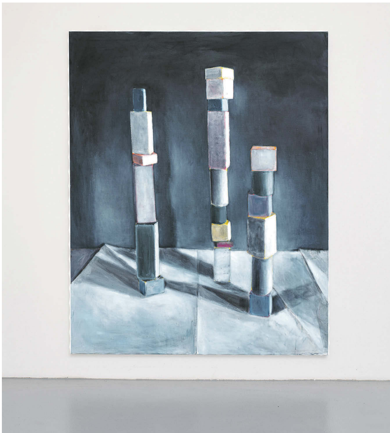
Výstava Ptáček v kleci probíhá v pražské Trafo Gallery.